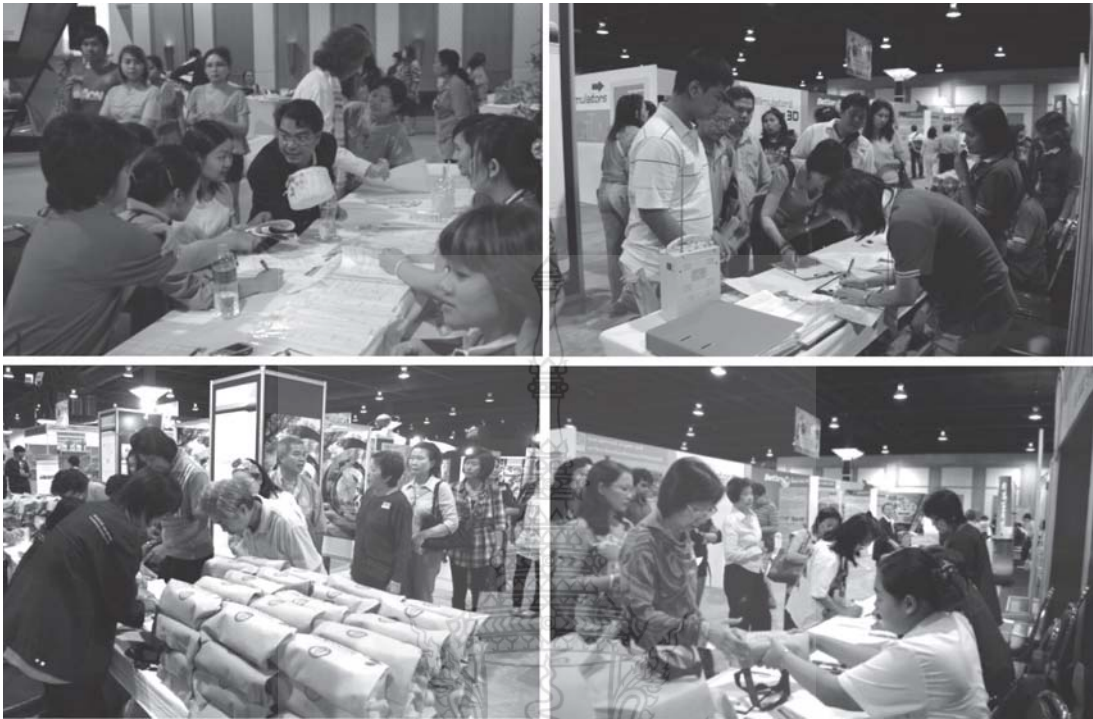
รูปที่ 1 กิจกรรมการรับสมัคร