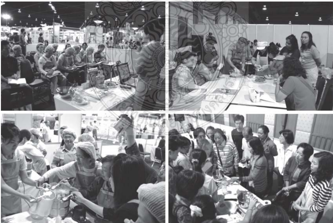
รูปที่ 2 กิจกรรมการถ่ายทอดเทคโนโลยี