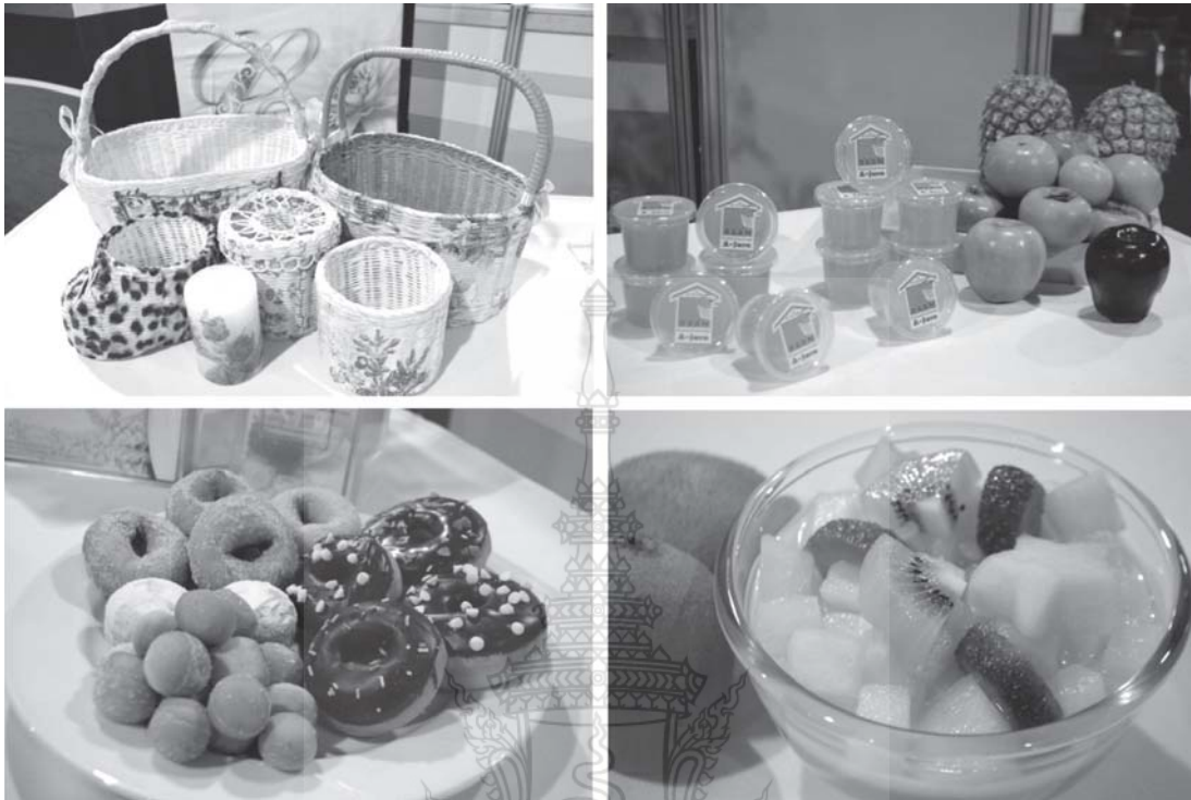
รูปที่ 3 ผลิตภัณฑ์จากการอบรม