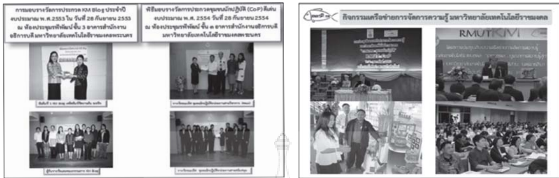
กระบวนการยกย่องชมเชยและการให้รางวัล