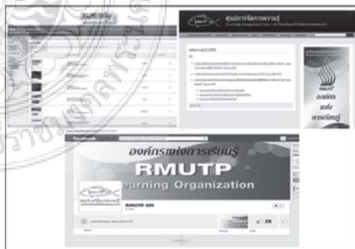
เทคโนโลยีสารสนเทศเพื่อการเรียนรู้