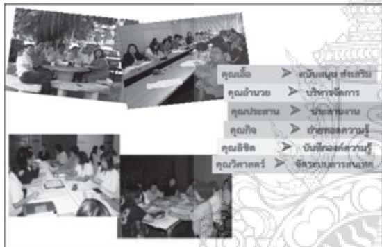
ชุมชนนักปฏิบัติ