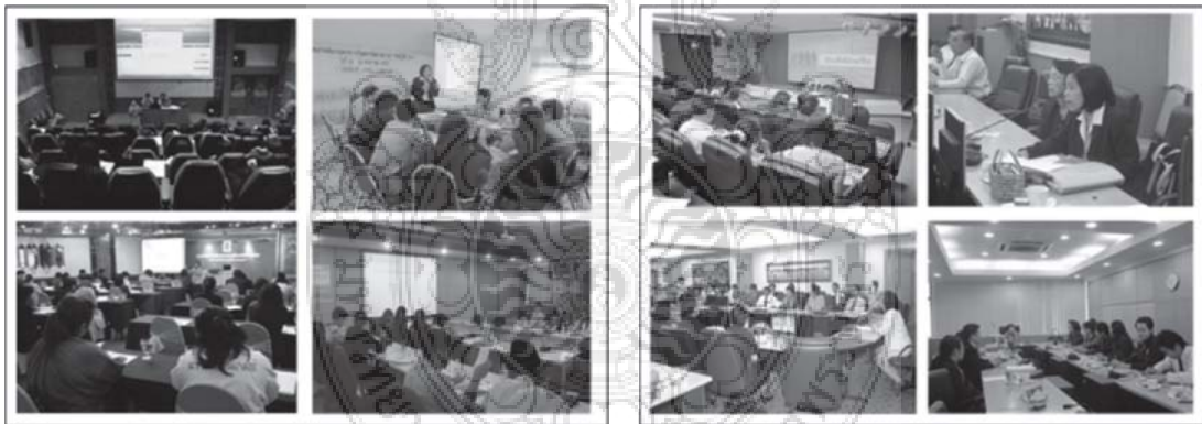
การถ่ายทอดความรู้

ตัวบ่งชี้ที่ 5.2 (2550) มีการพัฒนาสถาบันสู่องค์กรการเรียนรู้ โดยอาศัยผลการประเมินจากภายในและภายนอก ของสำนักงานรับรองมาตรฐานและประเมินคุณภาพการศึกษา (สมศ.) ตลอดจนเป็นแหล่งถ่ายทอดความรู้และศึกษาดูงานการจัดการความรู้ให้กับสถานศึกษาและหน่วยงานต่าง ๆ ได้แก่ สถาบันการพลศึกษา คณะบริหารธุรกิจและเทคโนโลยีสารสนเทศ มหาวิทยาลัยเทคโนโลยีราชมงคลตะวันออก วิทยาเขตจักรพงษ์ภูวนารถ มหาวิทยาลัยเทคโนโลยีราชมงคลล้านนา น่าน คณะศิลปศาสตร์ สถาบันการพลศึกษา วิทยาเขตศรีสะเกษ คณะเทคโนโลยีสารสนเทศ มหาวิทยาลัยราชภัฏเพชรบุรี กรมยุทธศึกษาทหาร กองบัญชาการทหารสูงสุด และสำนักราชเลขาธิการ