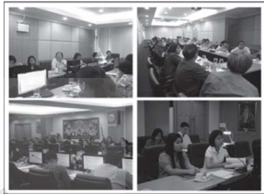
การถ่ายทอดแนวปฏิบัติที่ดี