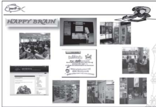
บรรยากาศการเรียนรู้