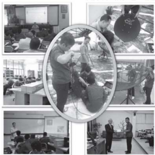
รูปที่ 1 ภาพกิจกรรมในการฝึกอบรมศิษย์พระดาบส เรื่อง การติดตั้งจานดาวเทียม

ประชากรของการศึกษาวิจัยครั้งนี้ คือ ศิษย์พระดาบส รุ่นที่ 37 แผนกช่างอิเล็กทรอนิกส์ ในสังกัดโรงเรียนพระดาบส กรุงเทพฯ ที่ลงทะเบียนเรียนวิชา การติดตั้งจานดาวเทียม ในภาคเรียนที่ 1/2556 จำนวน 15 คน ซึ่งเป็นกลุ่มตัวอย่างแบบเฉพาะเจาะจง (Purposive Sampling) โดยใช้แบบแผนการทดลองแบบกลุ่มตัวอย่างเดียว มีการทดสอบก่อนและหลังการทดลอง (One-Group Pretest-Posttest Design) (Franckel and Wallen, 2003: 272)