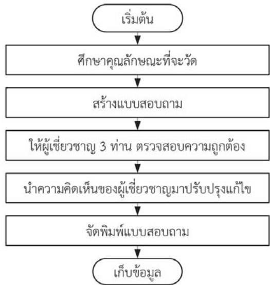
รูปที่ 3 ขั้นตอนการสร้างแบบสอบถาม

ส่วนที่ 3 เป็นข้อเสนอแนะ เพื่อใช้ปรับปรุงและพัฒนาหลักสูตรฝึกอบรม โดยใช้แบบสอบถามเป็นแบบปลายเปิด