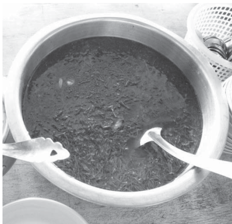
ภาพที่ 3 แกงส้มชะคราม