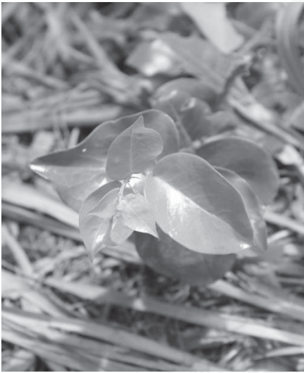
ภาพที่ 1 ยอดหนามพุด

3.1 ส่วนประกอบของอาหารพื้นบ้าน พบว่า สำหรับการทำอาหารคาวส่วนประกอบส่วนใหญ่จะหาได้จากท้องถิ่น เนื้อสัตว์ที่ใช้เป็นส่วนประกอบ เช่น ปลาหมอไทย ปลาหมอเทศ ปลาอีกรัง ปลากระบอก ปลาดุกทะเล ปลากะพง ปลาเก๋า ปลาทุ ปลาดตะเพียน ปลาสร้อย ปลานิล ปลาช่อน กุ้งกุลาดำ กุ้งแชบ๊วย กุ้งตะกาด ปูทะเล ปูแสม สำหรับส่วนประกอบที่เป็นผัก เช่น ผักปลัง ชะคราม ลูกสามสิบ ผักเบี้ย ยอดหนามพุด ดอก ผักโขมหิน ในส่วนของอาหารหวานส่วนประกอบหลักส่วนใหญ่จะใช้กะทิ น้ำตาลปีบ น้ำตาลทราย และสำหรับอาหารถนอมและแปรรูปอาหารจะใช้วัตถุดิบที่หาได้ เช่น ปลา กุ้ง และไข่เกลือเป็นส่วนประกอบในการถนอมอาหาร เช่น การทำแห้ง การถนอมโดยการใส่เกลือ เป็นต้น