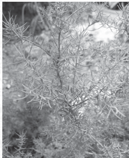
ภาพที่ 2 ต้นชะคราม

3.2 วิธีการทำอาหารพื้นบ้านชุมชนแพรกหนามแดง ส่วนใหญ่จะทำอาหารคาวประเภทแกงโดยนำผักพื้นบ้านที่มีอยู่ในท้องถิ่นมาใช้ในการทำอาหาร ตัวอย่างเช่น แกงส้มผักโขมหิน แกงส้มชะคราม แกงส้มผักปลัง แกงส้มยอดถั่วลันเตา แกงส้มยอดปรังทะเล แกงส้มดอกโสน แกงเลียงผักโขมหิน แกงอ่อมยอดหนามพุด สำหรับพริกแกงที่นำมาใช้ จะเป็นน้ำพริกแกงสำเร็จไม่ได้โขลกน้ำพริกแกงเองเหมือนในอดีตเพื่อความสะดวกในการทำ ผักที่นำมาใช้ในแกงถ้าผักชนิดใดมีรสขม เค็ม หรือเผ็ดต้องนำมาต้มก่อน อาหารหวานส่วนใหญ่จะเป็นประเภทต้ม เช่น ขนมต้ม กล้วยบวชชี บวดพักทอง ถั่วเขียวต้มน้ำตาล ข้าวเหนียวเปียกมะพร้าวอ่อน สาकुเปียกมะพร้าวอ่อน เป็นต้น โดยมีวิธีการทำที่ง่ายไม่ยุ่งยาก เช่น การทำกล้วยบวชชีจะต้มน้ำกล้วยว่าทั้งเปลือกจนสุก ปลูกเปลือกกล้วยหั่นกล้วยชิ้นพอคำ จากนั้นผสมกะทิ น้ำตาลทราย เกลือ ใส่หม้อน้ำตั้งไฟให้ร้อนใส่กล้วยที่หั่น พอเดือดราดด้วยหัวกะทิ สำหรับอาหารประเภทถนอมและแปรรูปอาหารที่นิยม คือ ปลาตากแห้ง ปลาแดดเดียว เป็นต้น