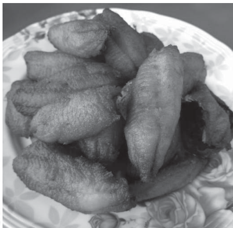
ภาพที่ 4 ปลาหมอคัดเดียว

สรุปองค์ความรู้จากการประกอบอาหารในส่วนของกรนำชะครามาใช้ไม่ว่าแกงส้ม หรือทานกับน้ำพริก จะเลือกชะครามที่อ่อน ซึ่งสังเกตได้จากต้นจะมีสีเขียวอ่อน หากมีสีเขียวเข้มอมม่วงจะเป็นชะครามที่แก่ ก่อนนำมาปรุงอาหารล้างให้สะอาดและต้องลวกในน้ำเดือด 2-3 นาที นำขึ้นมาแช่น้ำเย็นจัดอาจใช้น้ำผสมน้ำแข็งเพื่อให้ชะครามยังคงสีเขียว แช่ประมาณ 3 นาที ตักชะครามขึ้นป้อนให้สะอาดแล้วค่อยเอาไปใช้ตามต้องการ สาเหตุที่ต้องลวกชะครามก่อนเพราะชะครามเป็นผักที่มีรสเค็มการลวกจะลดความเค็มของชะครามลงได้ ภูมิปัญญานี้ได้รับการถ่ายทอดในครอบครัวจากรุ่นสู่รุ่น ขั้นตอนในการประกอบอาหารให้ใส่น้ำมันสัตว์ตอนน้ำเดือดและไม่ควรคนจะทำให้มีกลิ่นคาว สำหรับการทำให้ปลาหมอคัดเดียว หลังจากที่ได้ปลาเอาแต่เนื้อล้างให้สะอาด ใส่น้ำปลาและซีอิ้วหมักแล้วค่อยเอาไปตากแดด การหมักกับน้ำปลาและซีอิ้วจะทำให้เมื่อนำปลาไปทอดให้สุกรสชาติจะไม่เค็มมากและมีสีสวยกว่าการหมักกับเกลือ การถ่ายทอดภูมิปัญญาให้กับลูกหลานและคนในครอบครัวไม่ได้จัดเป็นระบบเพียงบอกกล่าวทำให้ดูและให้คนในครอบครัวช่วยทำเป็นบางครั้ง