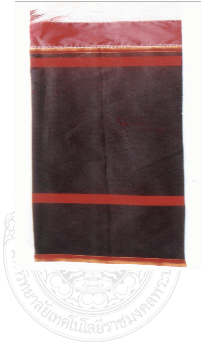
ภาพที่ 1-4 ซิ่นแล่

ซิ่นแล่ ตัวซิ่นของซิ่นแล่ทอเป็นพื้นดำตลอดทั้งตัวต่อจาก ดิ้นซิ่นแต่ส่วนตัวมีแถบสีแดง เชื่อมต่อกับดิ้นซิ่น เป็นซิ่นที่ใช้นุ่งทำงานอยู่ในบ้านหรือนอกบ้าน