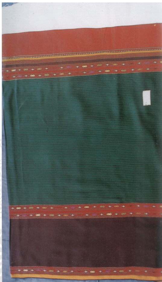
ภาพที่ 1-3 ซิ่นชิว

ซิ่นชิว ตีนซิ่นเป็นผ้าพื้นสีดำ ส่วนตัวซิ่น เป็นสีเขียว จกลายประกอบระหว่างรอย ต่อตีนกับตัวและตัวกับหัวซิ่นเป็นซิ่นที่ทอขึ้นใช้ใน่งทำงานอยู่กับบ้าน