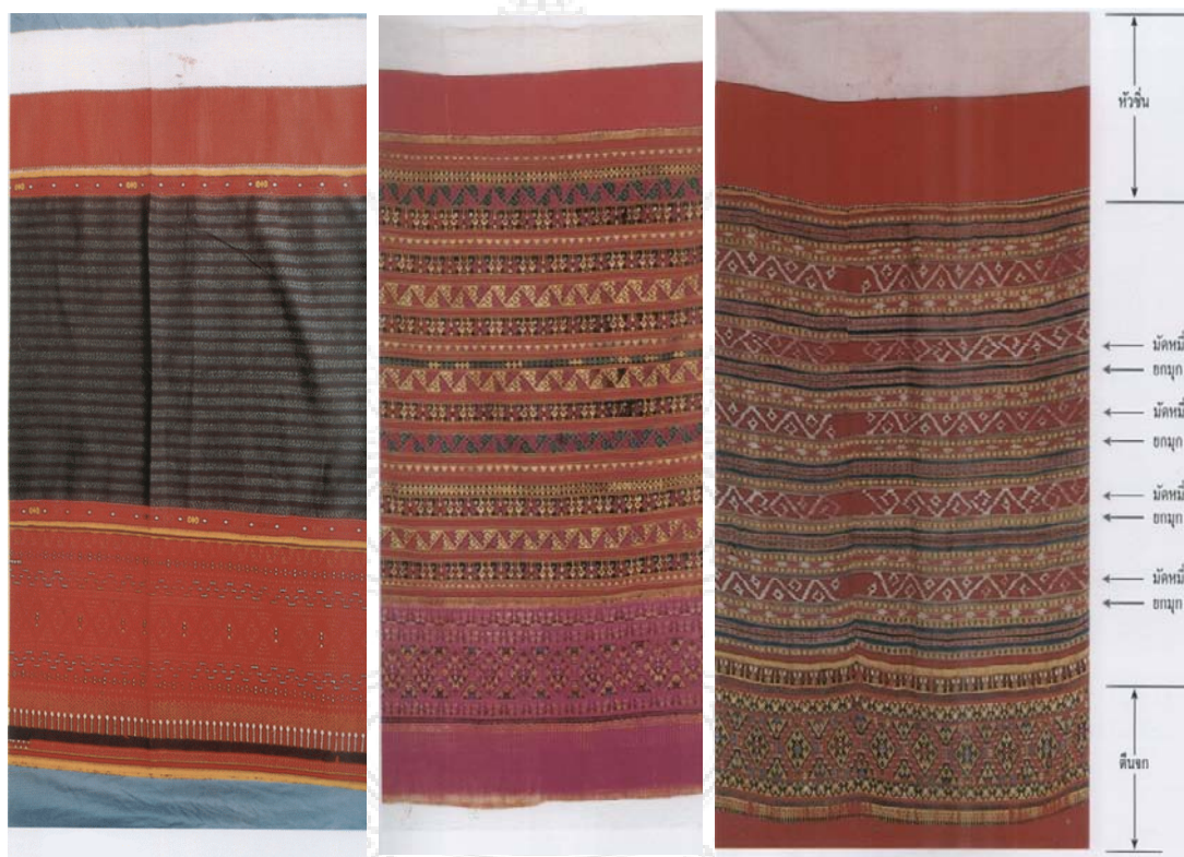
ซิ่นตีนจก จกทั้งตัว