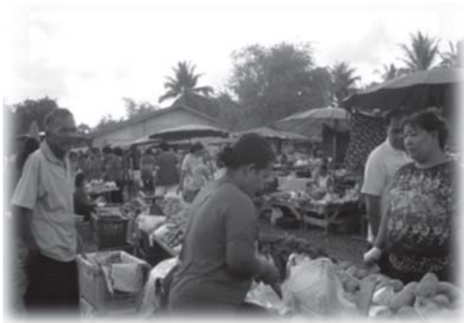
รูปที่ 2 การได้มาของทรัพยากรอาหาร : การซื้อที่ตลาดนัด