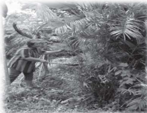
รูปที่ 7 การเข้าถึงอาหาร : การเก็บหากจากธรรมชาติ

3.1.4 การใช้ประโยชน์จากอาหาร ชาวใต้มีการจัดการอาหารและทรัพยากรอาหาร โดยใช้ความรู้ ปัญญา และทักษะในการจัดการทรัพยากรอาหาร โดยนำมาใช้ประโยชน์ในชีวิตประจำวัน ใช้เป็นที่ทำกิน ได้แก่ ทำนา ทำสวน เพื่อผลิตอาหาร และเสาะแสวงหาอาหาร รวมถึงเป็นแหล่งวัตถุดิบในการผลิตสิ่งของเครื่องใช้ในการดำรงชีวิต ไม่ว่าจะเป็นนำมาทำรั้ว ทำที่อยู่อาศัยให้สัตว์ ทำเครื่องมือเครื่องใช้ เช่น เครื่องมือจับสัตว์น้ำ ตลอดจนนำมาเป็นฟืนในการหุงต้ม และที่สำคัญที่สุด คือ การนำมาเป็นอาหารและยา การประกอบ