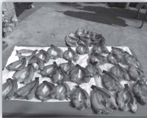
รูปที่ 8 การถนอมอาหาร : การตากแห้ง