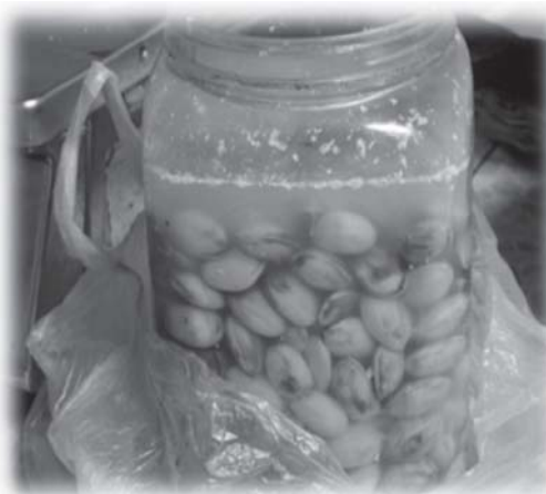
รูปที่ 9 การถนอมอาหาร : การดอง

สาเหตุสำคัญที่ชาวไต้หวันนิยมปรุงอาหารไว้บริโภคเองในครัวเรือน คือ ความต้องการพึ่งพาตนเองทางอาหารและการคำนึงถึงความปลอดภัยที่จะได้รับจากการบริโภค ชาวไต้หวันได้นำเอาปรัชญาเศรษฐกิจพอเพียงของพระบาทสมเด็จพระเจ้าอยู่หัวมาเป็นแนวทางในวิถีชีวิต โดยคำนึงถึงคำว่า “พอ” เป็นสำคัญในการดำเนินชีวิตทุกด้าน