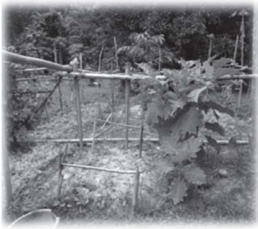
รูปที่ 3 การได้มาของทรัพยากรอาหาร : การเพาะปลูก

รูปแบบการจัดอาหาร พบว่า ชาวไต้หวันมีรับประทานอาหารวันละ 3 มื้อ แต่ละมื้อจะมีรายการอาหารประมาณ 3 รายการ โดยมีหลักคือ มื้อเย็น เป็นมื้อที่รับประทานอาหารพร้อมกัน และใน 1 วัน จะต้องบริโภคครบทั้ง 5 หมู่ ส่วนการถนอมและแปรรูปอาหาร พบว่า ชาวไต้หวันมีตากแห้งจำนวนมาก ร่องลงมา คือ ทำเค็ม ดองหมัก เพาะ และรมควัน สำหรับการประกอบอาหารในงานประเพณี อาจไม่แตกต่างจากที่ประกอบอาหารประจำวันนัก หากแต่จะมีการทำขึ้นเป็นพิเศษ เช่น แกงก็จะใส่กะทิ หรือมีรายการอาหาร