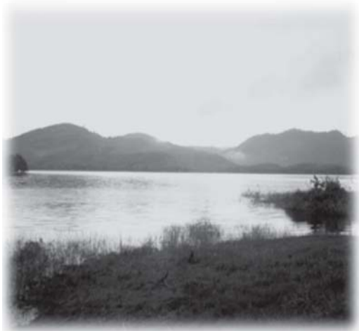
รูปที่ 4 การมีอยู่ของทรัพยากรอาหาร : อ่างเก็บน้ำ