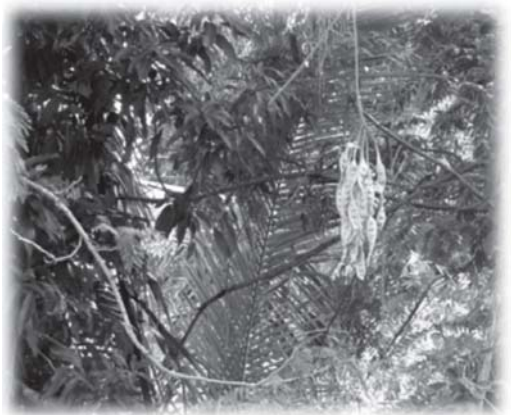
รูปที่ 5 การมีอยู่ของทรัพยากรอาหาร : ป่าบริเวณบ้าน

ภาพรวมการมีอยู่ของอาหารท้องถิ่นได้ พบว่า ยังมีทรัพยากรอาหารหลากหลายชนิด (Species Diversity) และการมีทรัพยากรอาหารที่หลากหลายเสมือนเป็นคลังอาหารที่เป็นหลักประกันความมั่นคงทางอาหารได้ในระดับหนึ่ง ทรัพยากรอาหารประเภทพืชผักและปลา เป็นทรัพยากรอาหารที่ยังมีปริมาณเพียงพอต่อการบริโภคในท้องถิ่น แต่ก็มีหลายชนิดที่มีปริมาณลดน้อยลง เช่น ลัตว์ป่า พืชบางชนิด ปลาบางชนิด อันเป็นผลมาจากการ