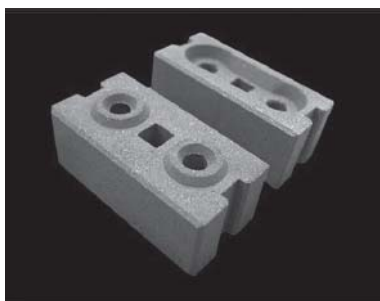
รูปที่ 1 Interlocking Block