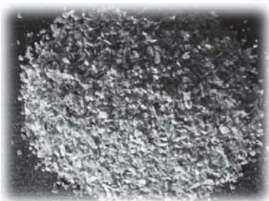
รูปที่ 2 Crushed oyster shell

2.1.2 เปลือกหอยนางรมบดไม่ผ่านกระบวนการเผา โดยผ่านการร่อนตะแกรงเบอร์ 100 รูปที่ 2