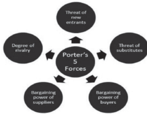
ภาพที่ 3 พลังผลักดันทั้งห้าของพอร์เตอร์ (Porter's 5 Forces) ที่มา: ประยุกต์จาก Wheelen & Hunger (2004: 61)