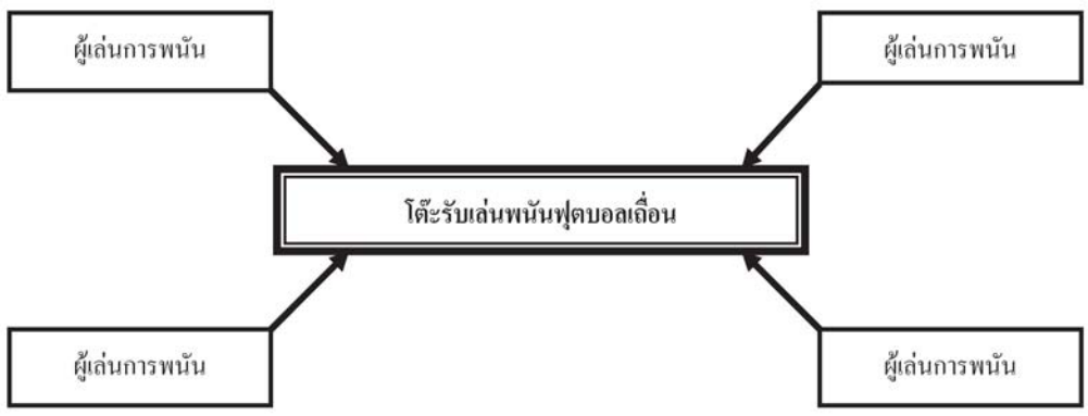
รูปที่ 1 รูปแบบการเล่นฟุตบอลในประเทศไทยโดยผ่านโต๊ะรับเล่นพนันฟุตบอลเถื่อน

โต๊ะรับเล่นพนันฟุตบอลรายย่อยที่ผู้เล่นรู้จัก (ดังรูปที่ 1-2) โดยมีปัจจัยจากความน่าเชื่อถือหรือเครดิตเป็นเกณฑ์ การติดต่อเพื่อเล่นพนันจะเป็นการติดต่อกันทางโทรศัพท์ โดยก่อนการเล่นพนันฟุตบอลก็จะมีการศึกษาข้อมูลต่าง ๆ จากหนังสือพิมพ์กีฬาเป็นหลัก และแหล่งข้อมูลอื่น ๆ ได้แก่ รายการกีฬาทางโทรทัศน์ เพื่อน โต๊ะพนันฟุตบอล และทางโทรศัพท์ รายการแข่งขันที่นิยมเล่นพนันฟุตบอลมากที่สุดจะเป็นการแข่งขันฟุตบอลจากประเทศอังกฤษ