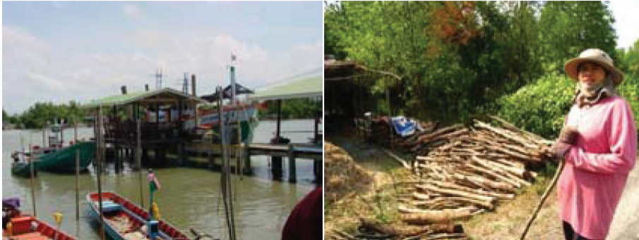
รูปที่ 2 วิถีชีวิตของคนในชุมชนยี่สาร

การศึกษาครั้งนี้เป็นการวิจัยเชิงคุณภาพ โดยมีขั้นตอนในการดำเนินการ ดังนี้