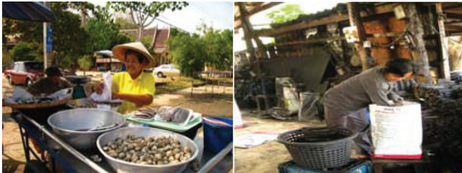
รูปที่ 4 การใช้ทรัพยากรจากป่าชายเลนเพื่อประโยชน์ทางเศรษฐกิจ