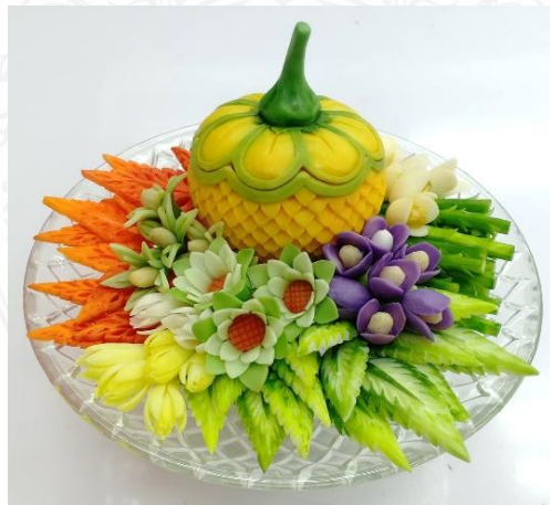
ภาพที่ 3 ผลิตรัตนธ์ของที่ระลึกด้วยการแกะสลักสบู่ในรูปแบบผักเครื่องจิ้ม

1.4 ผลการวิเคราะห์ข้อมูลความพึงพอใจต่อผลิตรัตนธ์ของที่ระลึกด้วยการแกะสลักสบู่ในรูปแบบผักเครื่องจิ้ม ของบุคคลทั่วไป