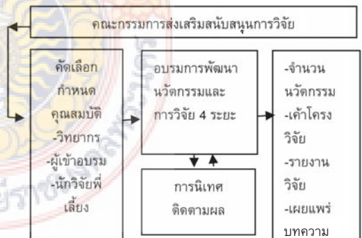
รูปที่ 2 รูปแบบการพัฒนาครุอาชีวศึกษาเป็นครุนักวิจัย

2.3.2 ออกแบบรูปแบบการดำเนินงาน ได้ออกแบบรูปแบบการพัฒนาครุอาชีวศึกษาเพื่อเป็นครุนักวิจัย ดังรูปที่ 2