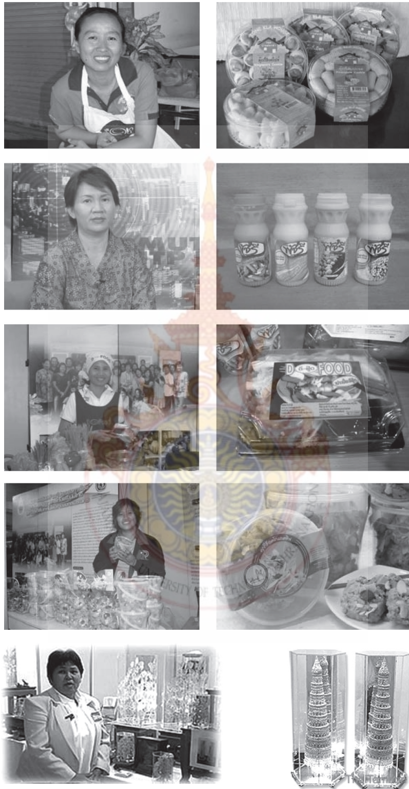
รูปที่ 2 กิจกรรมบ่มเพาะวิสาหกิจ สาขาธุรกิจอาหาร