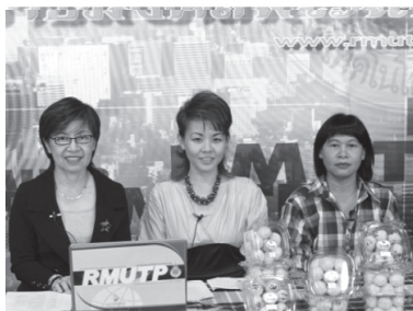
รูปที่ 1 รูปกิจกรรมโครงการเสริมสร้างผู้ประกอบการใหม่ สาขาธุรกิจอาหารไทยและขนมไทย